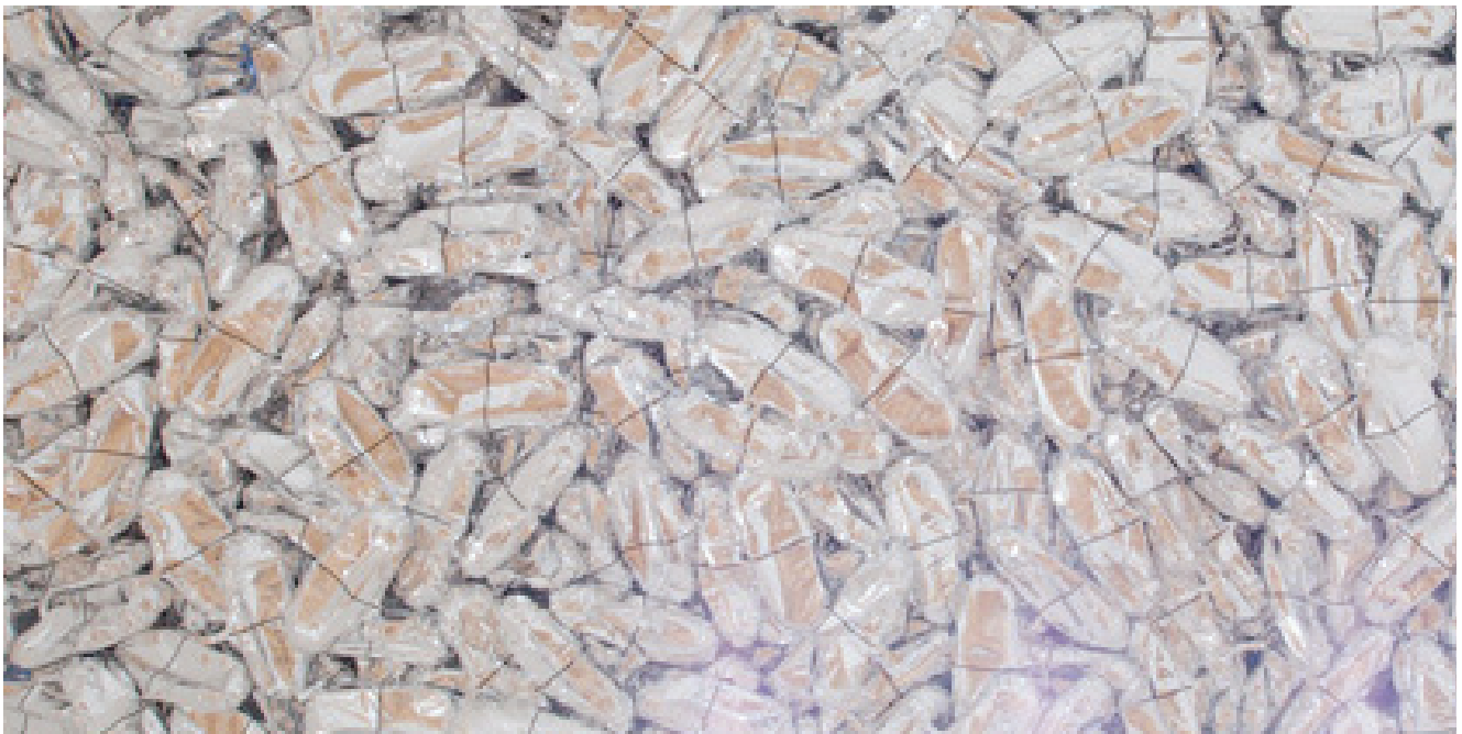
General Idea, The Magi® Bullet , 1992, Installation, ballons mylar, hélium, Dimensions variables, Ed 3/3