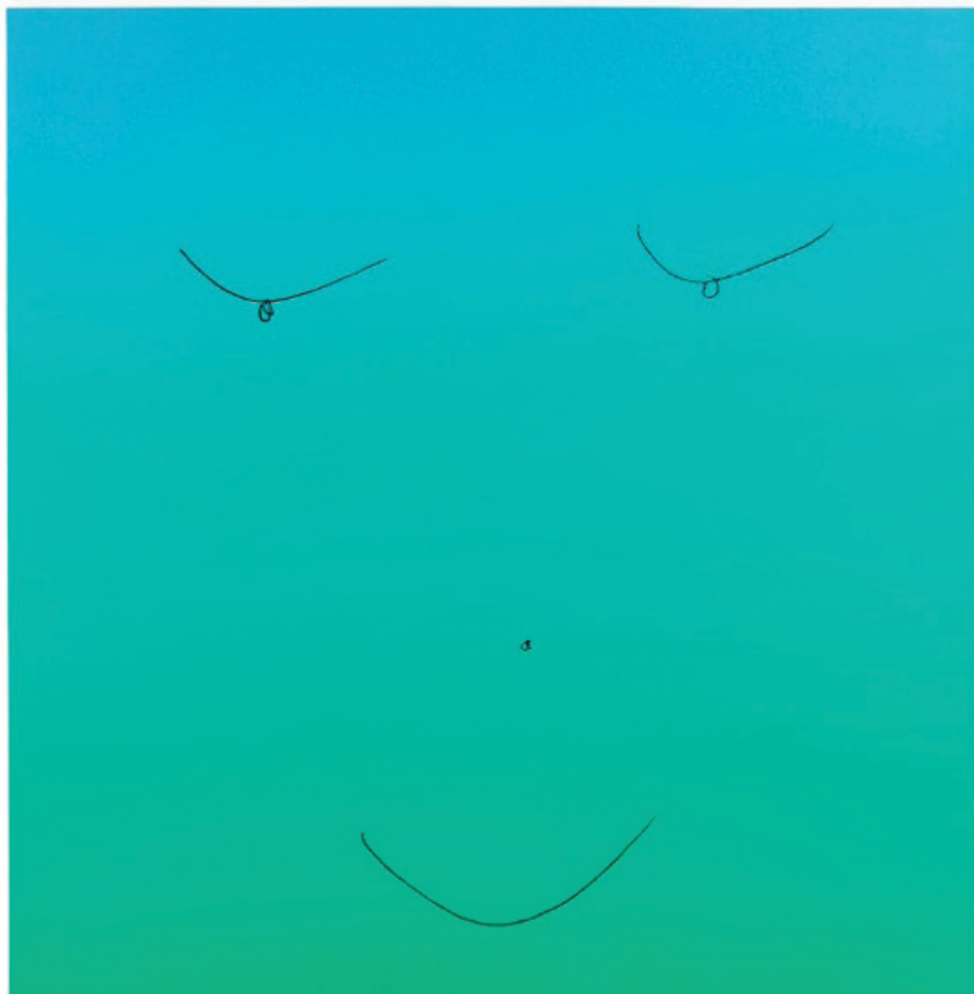
Rob PRUITT, Mother Earth , 2012 peinture acrylique et flochage sur toile, 215,9 x 208,3 cm